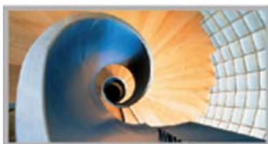
Spindeltreppe mit Glasbausteinwand